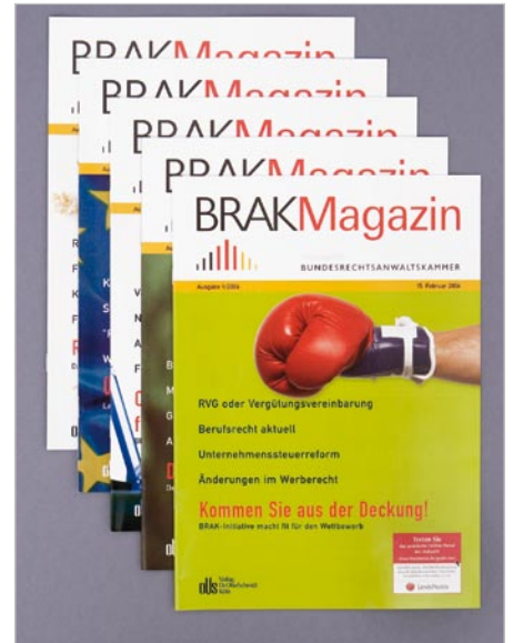
Redaktionelle Begleitung: Die Initiative im Mitgliedermagazin