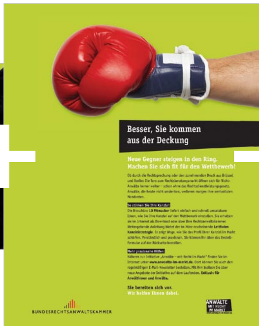
Wandel anstoßen: Die Auftaktanzeige der Initiative