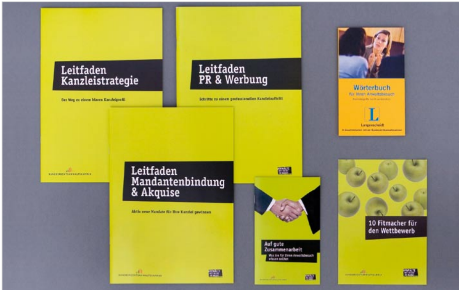
Unterstützung für Anwälte, Informationsmaterialien für Mandanten: Die Produkte der Initiative