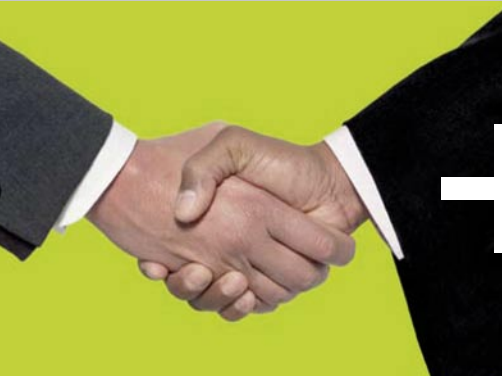
Vorbehalte abbauen: Die Initiative informiert über die Arbeit des Anwalts.